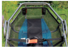
イコライザー取り付け後のハンドル収納例