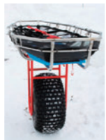
フレームにはパウダー塗装処理をし雪等の付着に配慮しています