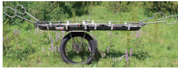
イコライザー + テラ・テイマー取り付け例

※各種リッター及びトレイル・ホイール(別売)との組み合わせとハンドルベースを事前に取り付ける必要があります。 ※イコライザーはリフティングのアタッチメントポイントとしては使用できません。