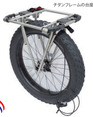
チタンフレームの台座