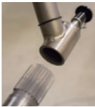
ハンドルは取り外しと24段階の角度調整が可能です