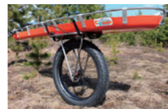
テラ・テイマー取り付け例