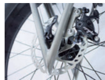
【機械式ディスクブレーキ】ブレーキアクチュエーターはリッターのフレームに取り付けます

ブレーキアクチュエーター用クランプの取り付けフレーム径 5/8in (Φ15.87mm) 3/4in (Φ19.05mm) 1in (Φ25.4mm) 組み合わせるリッターのフレーム径をお選びください。持ち運ぶことを考慮し、ベースフレームと車輪が分割でき非常に軽量です。