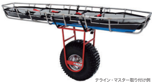
テライン・マスター取り付け例 ※リッターは別売です。