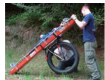
2名での取り付けイメージ