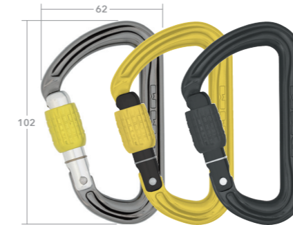
スクリュージェート