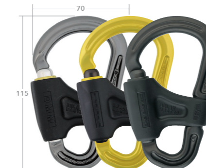
スクリュージェート