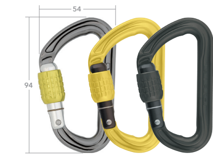
スクリュージェート