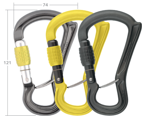
スクリュージェート