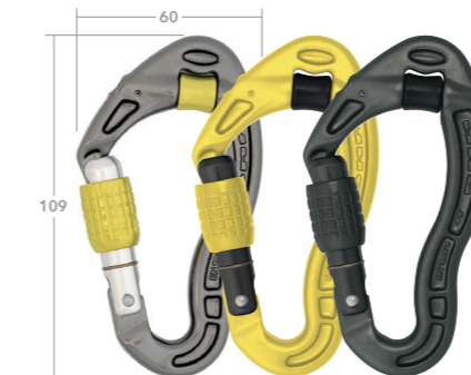
スクリュージェート

シャドー ロックセーフ 3カラーパック ¥15,000(税込¥16,500) A307-P3