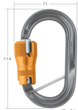
ロックセーフ ANSI・CB付き